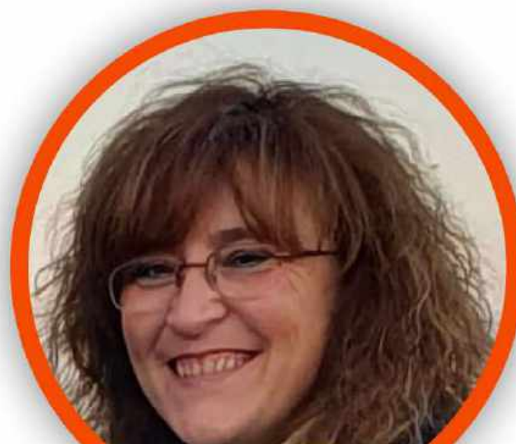
MARIANGELA MAPELLI SCUOLA PRIMARIA