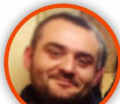
ROBERTO ZOLLO SCUOLA PRIMARIA