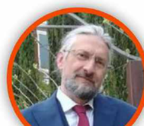
MASSIMO TAVOLA SECONDARIA DI PRIMO GRADO